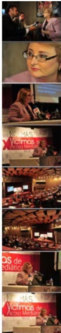
FORO MÚLTIPLE DE CONFERENCIAS EN CIESPAL QUITO 2014.