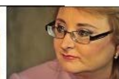
2012 Quito (Ecuador)